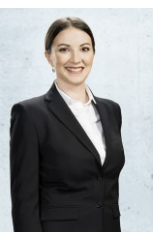
Corinna zu Sayn- Wittgenstein Berlin