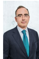
Luis Pérez-Sala Barcelona